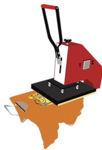
Imagem já recortada e transferida para a camiseta