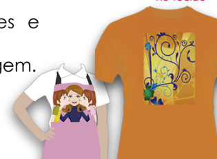
Imagem Finalizada no Tecido